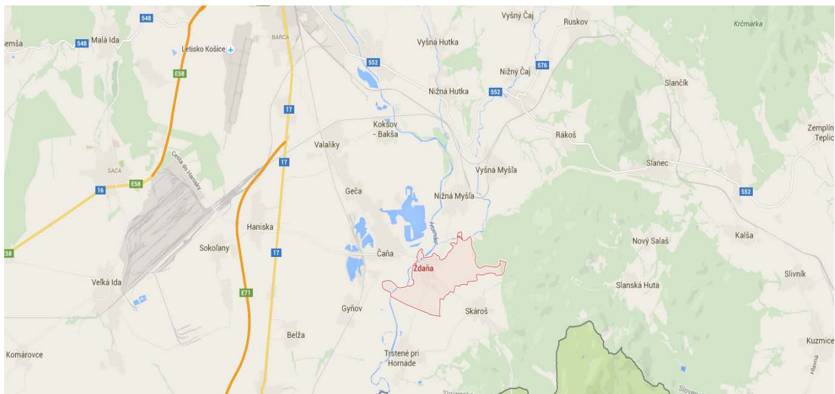
Obrázok Mapa polohy obce Ždaňa

Obec Ždaňa leží v nadmorskej výške 185 m juhovýchodne od Košíc na styku Košickej kotliny so Slanskými vrchmi pri vtoku rieky Olšavy do Hornádu. Kataster obce sa rozprestiera na úpätí Slanských vrchov, zo západu ju ohraničuje tok rieky Hornád, ktorá je v týchto úsekoch štrkonosná, so zaujímavými brehovými porastami. Južnou časťou obce preteká Turecký potok, ktorého brehové porasty dotvárajú zaujímavú krajinnú scenériu obce. Územie je zatriedené do mierne teplej, mierne suchej oblasti s chladnejšou zimou, ročný úhrn zrážok sa pohybuje v rozpätí 600 - 700 mm.